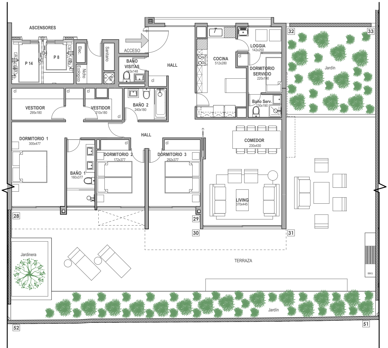
PLANTA ESC. 1:125

EDIFICIO D | PISO 1 | SUPERFICIE ÚTIL 145,5 m 2 | TERRAZA 109,7 m 2 | JARDÍN 70,3 m 2 | TOTAL 325,5 m 2