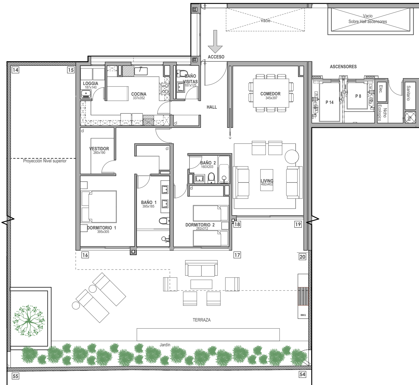
PLANTA ESC. 1:125

EDIFICIO C | PISO 1 | SUPERFICIE ÚTIL 129,3 m 2 | TERRAZA 125,6 m 2 | JARDÍN 34,8 m 2 | TOTAL 289,7 m 2