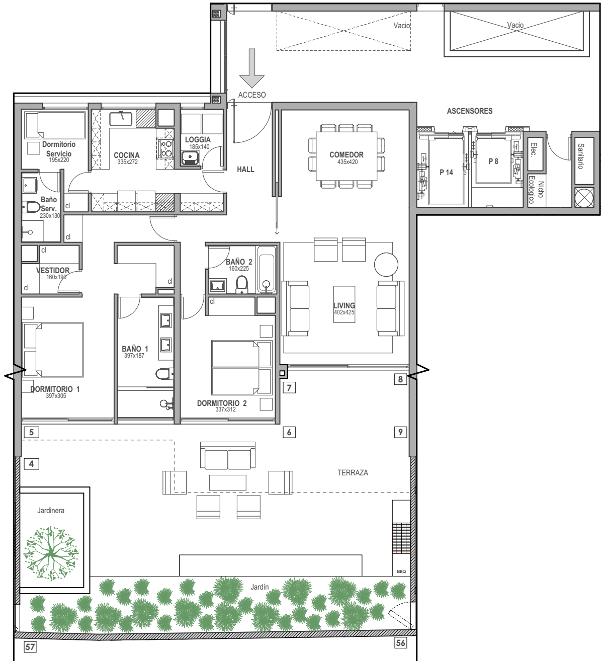
PLANTA ESC. 1:125

EDIFICIO B | PISO 1 | SUPERFICIE ÚTIL 129,2 m 2 | TERRAZA 65,4 m 2 | JARDÍN 33,3 m 2 | TOTAL 227,9 m 2