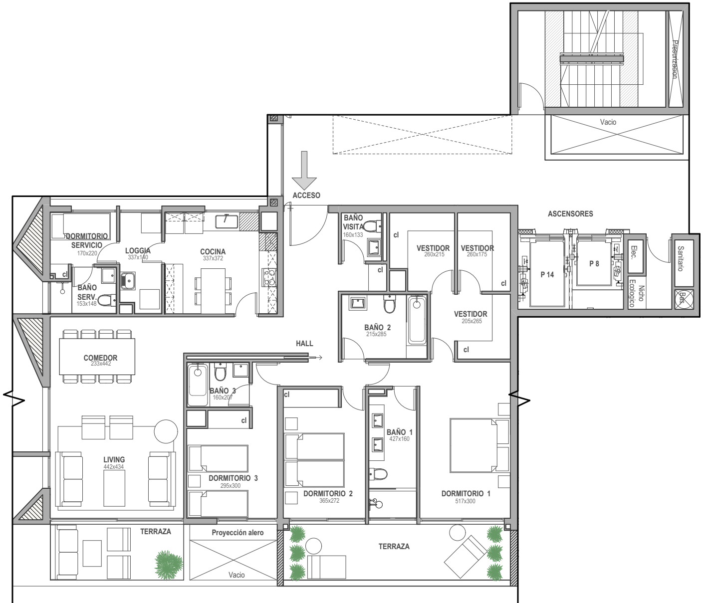
PLANTA ESC. 1:125

EDIFICIO A | PISOS 2 al 5 | SUPERFICIE ÚTIL 176,5 m 2 | TERRAZA 28,8 m 2 | TOTAL 205,3 m 2