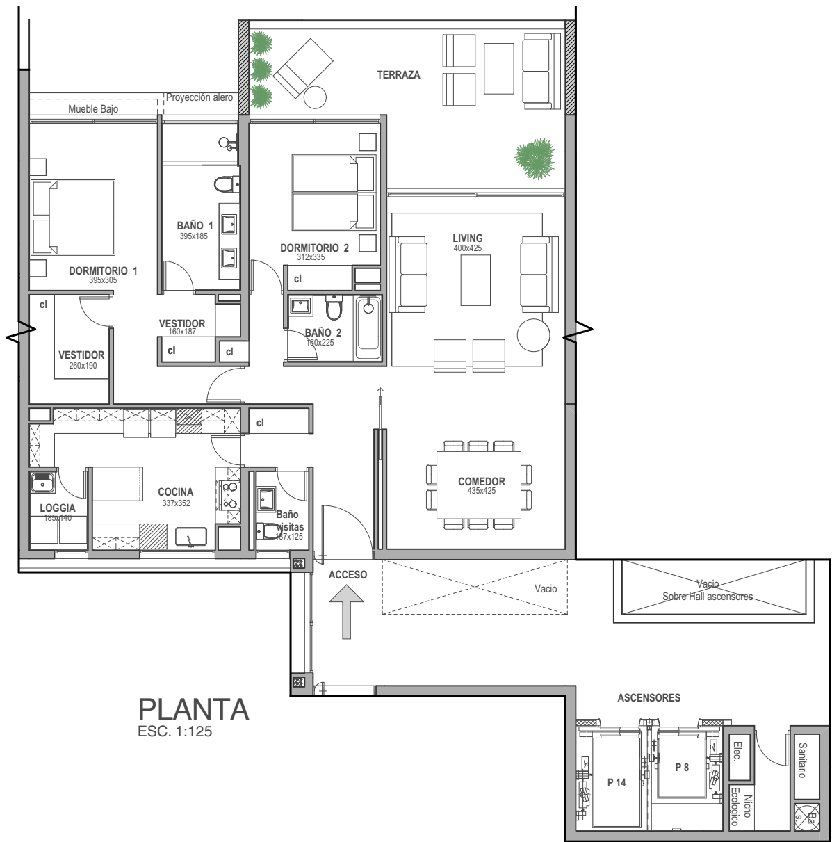
PLANTA ESC. 1:125

EDIFICIO D PISO 2 al 5 | SUPERFICIE ÚTIL 128,8 m 2 | TERRAZA 25,4 m 2 | TOTAL 154,2 m 2