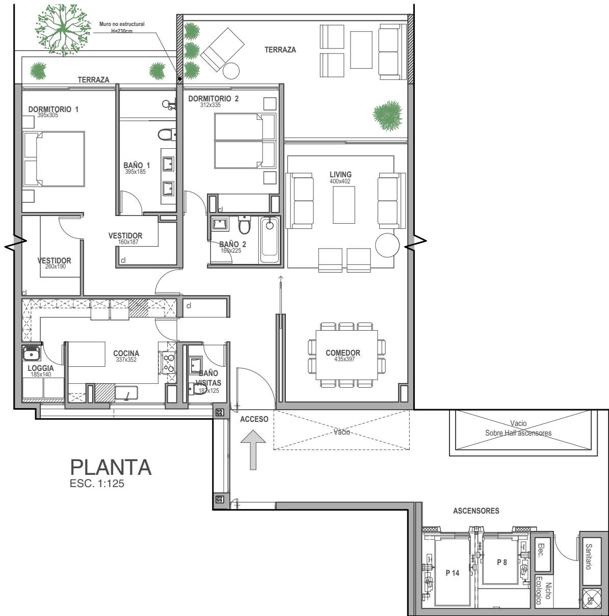
PLANTA ESC. 1:125

EDIFICIO C | PISO 1 | SUPERFICIE ÚTIL 130,3 m 2 | TERRAZA 25,1 m 2 | TOTAL 155,4 m 2