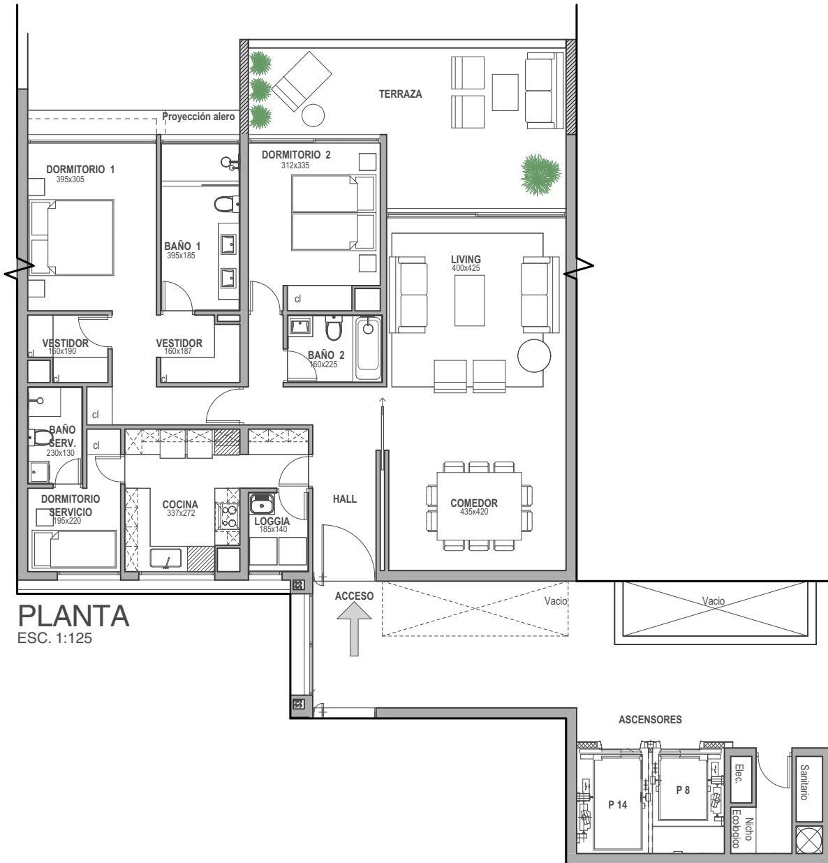
PLANTA ESC. 1:125

EDIFICIO B | PISO 2 al 5 | SUPERFICIE ÚTIL 128,9 m 2 | TERRAZA 25,4 m 2 | TOTAL 154,3 m 2