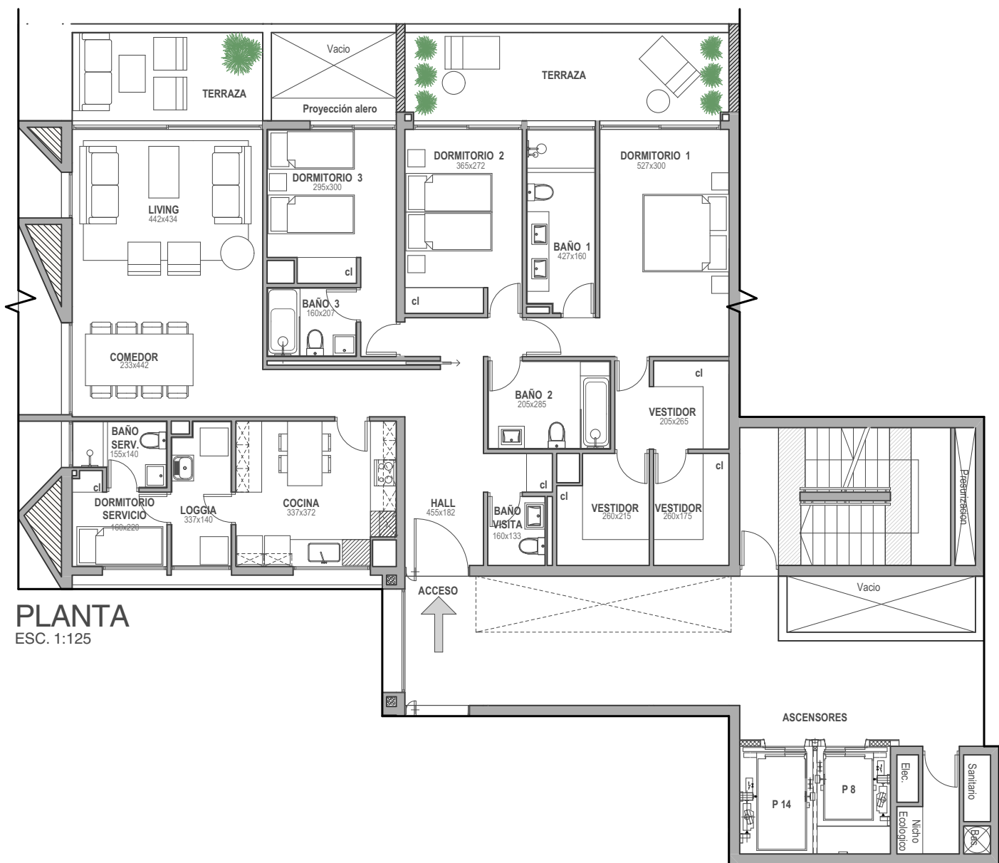
PLANTA ESC. 1:125

EDIFICIO A | PISOS 2 al 5 | SUPERFICIE ÚTIL 176,5 m 2 | TERRAZA 31,6 m 2 | TOTAL 208,1 m 2